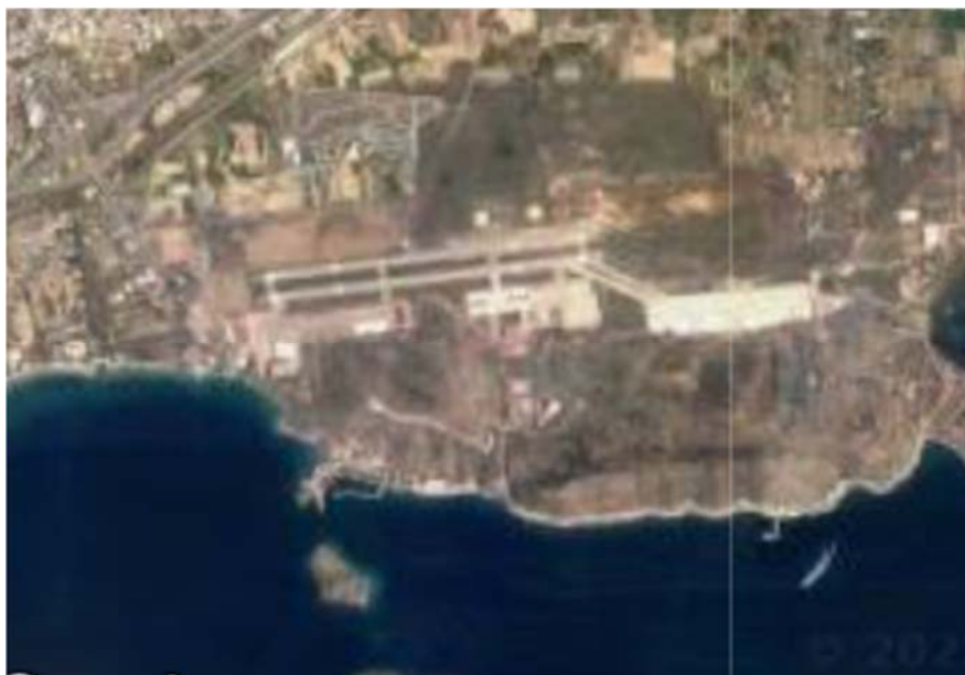
Εικ. 1 (συνέχεια): Διαστάσεις Διαδρόμου 08R/26L 3953 ft x 125 ft (1205 m x 38 m).