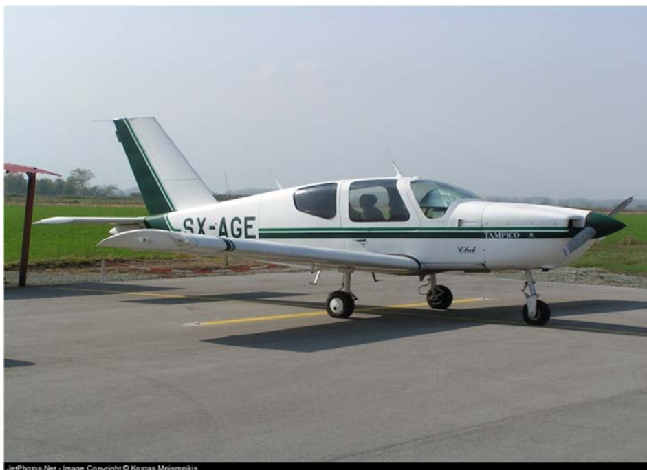
Φωτ. 1: Φωτογραφία του α/φους SX-AGE.